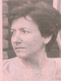
GAGLIANICO. Cremonte e la Alloisio: due protagoniste della lunga stagione su strada della Provincia.

no però per i protagonisti del Criterium.